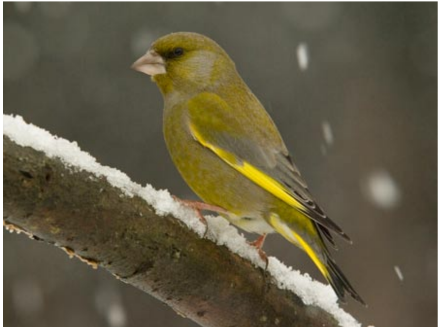
Nii pildil oleva rohevindi isaslinnu kui ka hallika emaslinnu tunneb kaugelt ära erekollase tiivatriibu järgi.

Ühel toredal karmil talvehommikul jälginis koduaknast mõnekümne rohevindi askeldamist ümber päevalille- ja rapsiseemnetega varustatud toidulaua ning tabasin end mõttelt, et rohevindi talvisel arvukusel ja järjest popimaks muutuv rapsikasvatusel võib mingi seos olla... Peagi meenus, et Viljandimaal Räpu kandis tehtud sügisestel põllulindude loendustel olid vintlased arvuka-