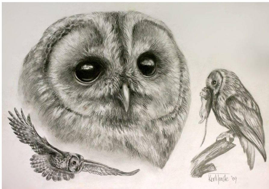
JOONISTUS: KERLI TOODE, 18 A