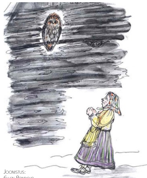
Joonistus: ELLEN RANDOJA

seal kedagi surma, öökull oli rehealla lennanud. Võib-olla hiirile... vili ju.