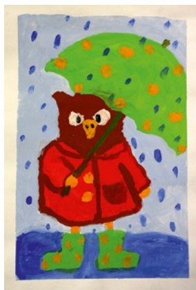
JOONISTUS: KATJA TEREHHOVA, 5 A