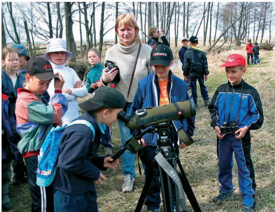
Kõik saab alguse väikestest asjadest.

Soovime edasi liikuda samm-sammult, alustades õhemast väljaandest ning minnes huvi kasvamisest ja uute mõtete ning linnuhuviliste tagasiside toel võimaliku mahukama ja tihedama infokandja suunas. Meie naabritel lõuna ja põhja pool on ju ammu olemas