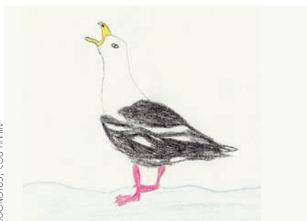
KOONISTUS: EOU ARHIIV

Selleks et määrata lendavat kajakat oskusi lihtsalt palju veel vajaka. Mis värvi ta nokk? Kas triibud on sabal? Ei kõrgusest silm seda mul taba.