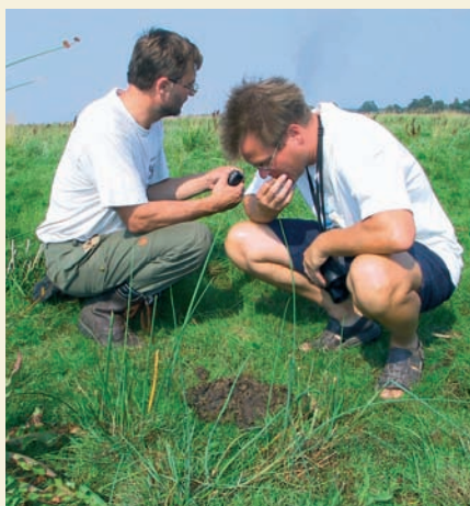
Linnuatlase tegemine on vahel tõsine peamurdmine.

Tagantjärele mõeldes oleme olnud väga idealistlikult meelestatud. Arvasime, et Ikarus-busside asendumine Volvode ja Toyotadega on muutnud inimesed liikuvamaks ja üleüldse vabamaks. Arvasime, et kümned kvaliteetsed