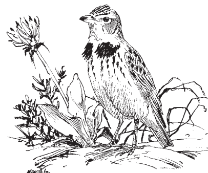
Joonistus: JUAN VARELA

Eelmise aasta viimasel päeval nähti Eestis esmakordselt lõunamaise päritoluga stepilöökest ( Melanocorypha calandra ). Kui harulduste komisjon vaatluse kinnitab, on nüüdseks Eestis kohatud 368 linnuliiki. Eriti väärib märkimist, et selle linnuga koos tegutses ka välja-väike-lööke ( Calandrella brachydactyla ), keda varem on meil kohatud vaid kolmel korral.